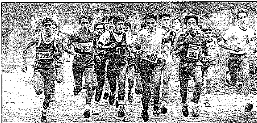
Los mejores atletas corredores de cross de España en edad escolar, competirán mañana en Sevilla.