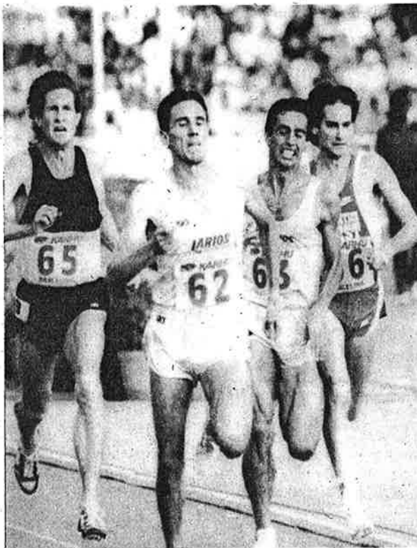
Esta es la llegada a la milla. De izquierda a derecha: John Walker, José Luis González, José Manuel Abascal y Jim Spivey.

Por otra parte, el otro gran polo de atención de las pruebas fue el salto de altura donde Patrick Sjoeberg, que recientemente dejó el record