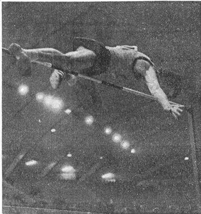
Marqueta, atracción en la inauguración para atletismo del pabellón municipal