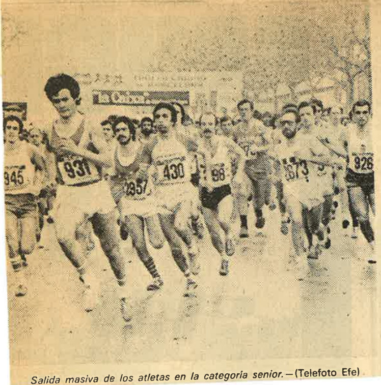
Salida masiva de los atletas en la categoría senior.