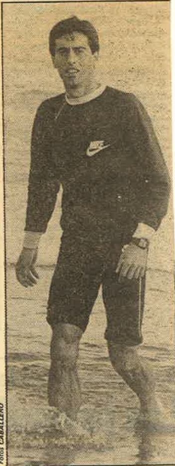
Durante las próximas Navidades, Abascal cambia la playa del Sardinero por la del Inglés, en Maspalomas

Bajo la dirección de Luis Miguel Landa y Juan Manuel Sánchez, los maratonianos acudirán a Torremolinos, con el fin de ir conociendo el recorrido en el que