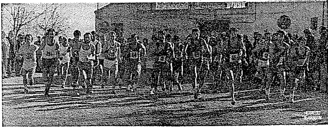
Salida de la prueba de seniors. Fueron bastantes los aficionados que acudieron a la celebración de la carrera

NUMEROSO PUBLICO SE INTERESO POR LA CARRERA