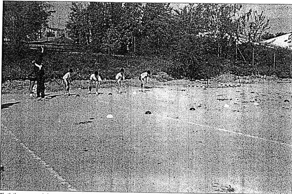
El atletismo es uno de los puntos fuertes del deporte del Servicio Comarcal "Corredor del Ebro II".