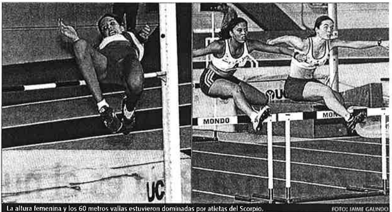
La altura femenina y los 60 metros vallas estuvieron dominadas por atletas del Scorpio.