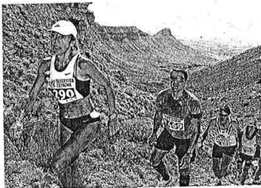
Los participantes de la Desértica Extrema de Belchite, ayer.