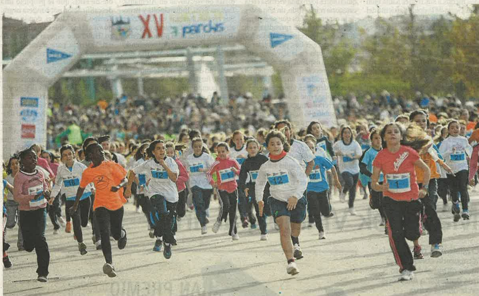
Tanto corredores como asistentes disfrutaron de una agradable jornada deportiva.

Con más de 5.500 participantes, esta edición se convirtió en una de las más numerosas y en una de las que más campeones y campeonas tuvo entre sus filas, tantos como corredores.