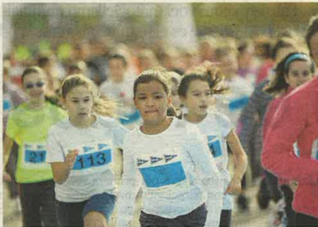
Algunas de las corredoras durante la prueba.