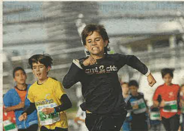
Los pequeños se esforzaron al máximo.