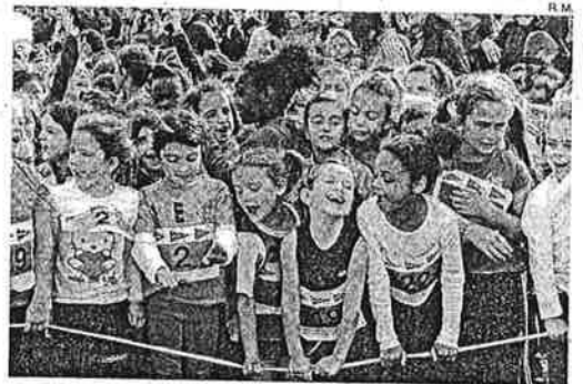
▶ Unas niñas esperan la salida de una de las carreras.

El Sagrado Corazón volvió a ganar en su carrera preferida. El centro escolar del barrio del Actur fue el que más participantes llevó a la Carrera del Parchís, un total de 342. Ganó por los pelos a Cortés de Aragón, que se quedó en 336. Lo mejor fue la guinda de los más pequeños. Los niños de 5 y 6 años llevaban el dorsal rojo y corrieron 400 metros. Con sus gestos y sus risas hicieron las delicias de toda la concurrencia. Fueron las estrellas de una mañana de película. ≡