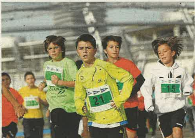
El sol, aunque con frío, fue el protagonista.