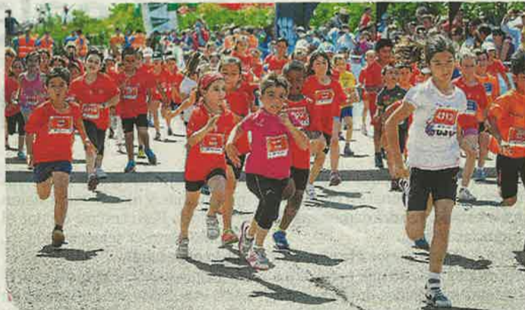
La 10 K contó también con su habitual carrera para los pequeños. A. N.