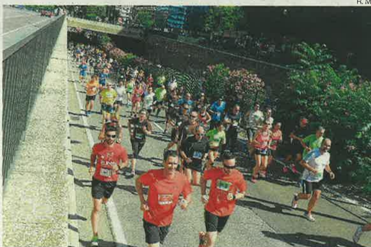
► La carrera a su paso por Cesáreo Alierta.