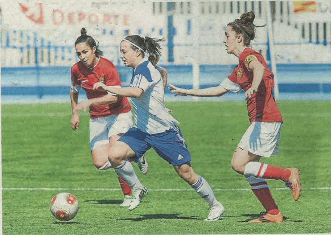
Un encuentro del Transportes Alcaine en el campo Pedro Sancho durante esta temporada.