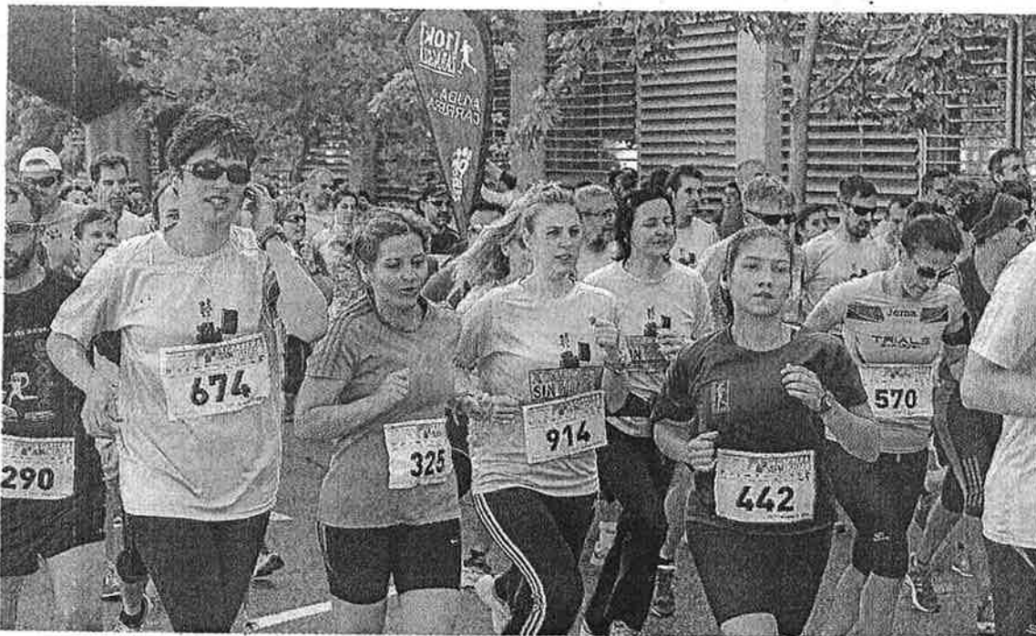
Un total de 640 mujeres y 694 hombres participaron en la prueba solidaria de ayer. RAQUEL HERNÁNDEZ BERNAL

Mayo y Antoñanzas, del Scorpio, ganaron ayer y el sábado, en la prueba escolar, el IES Virgen del Pilar