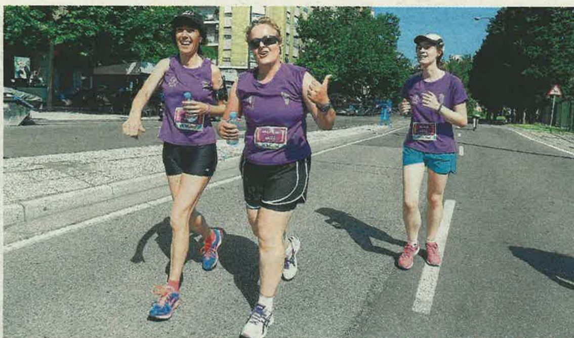
► Tres atletas femeninas del Reto 10K Women Running 2014.