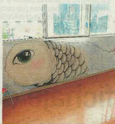
El área de Quemados con su nuevo aspecto.