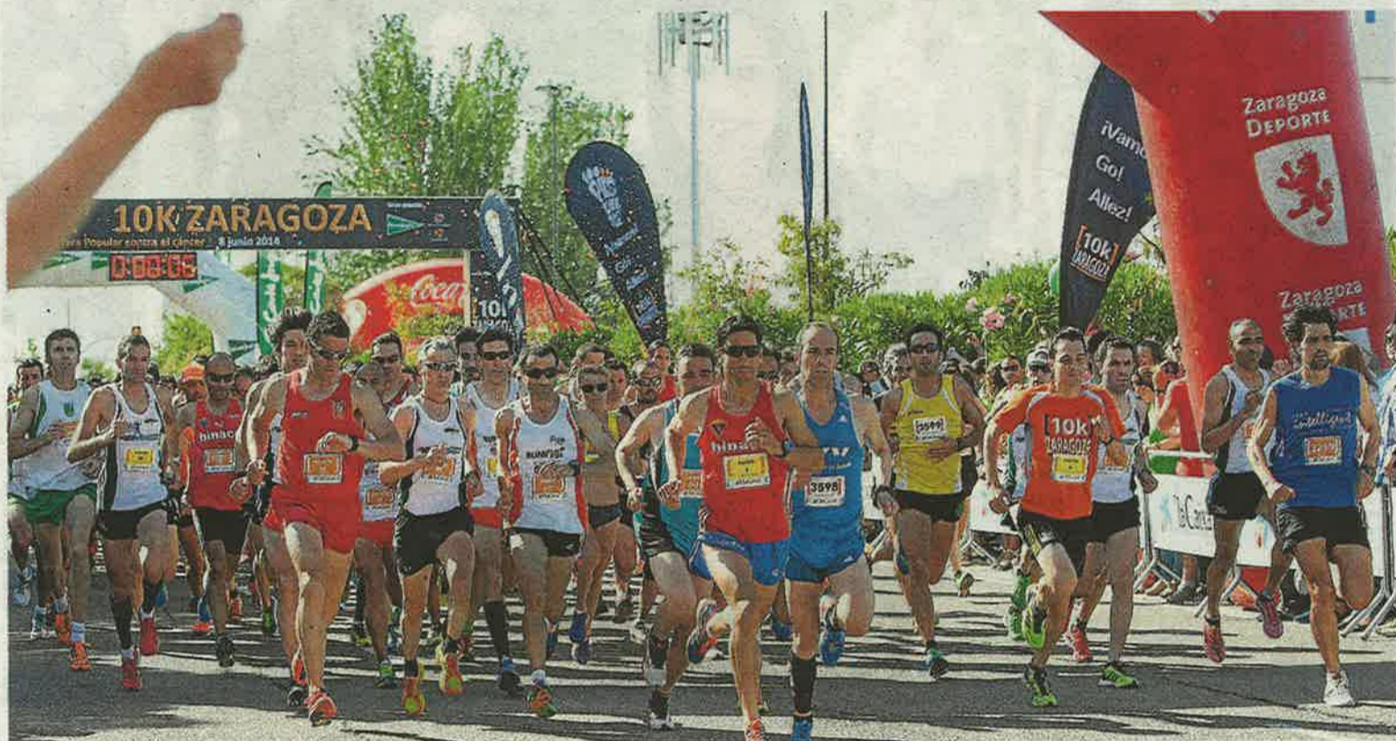
La corredores de la 10 K, nada más producirse la salida de la prueba.