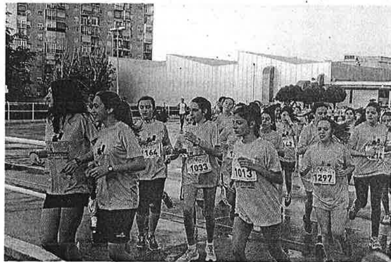
Varias de las muchas jóvenes que tomaron la salida ayer. AFICIÓN