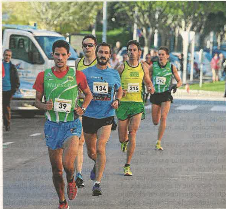
Sabhi (39) lidera la carrera de ayer en Huesca. RAFAEL GOBANTES

La carrera, que estuvo organizada por la Fundación Alcoraz con la colaboración del club atletismo Huesca, contó con una participación de 538 atletas que recorrieron los 21 kilómetros de que constaba la prueba por un circuito urbano de la capital oscense en una mañana soleada y con bastante público.