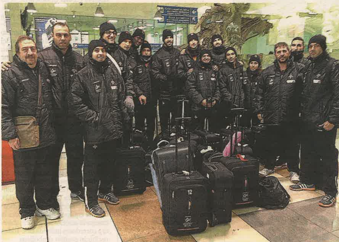
La plantilla y cuerpo técnico del CAI Teruel, ayer en el aeropuerto de Novosibirsk.

El encuentro, que tendrá lugar a las dos de la tarde hora española (se puede ver en directo en Aragón TV HD y en laolal.tv, en internet), se perfila como uno de los