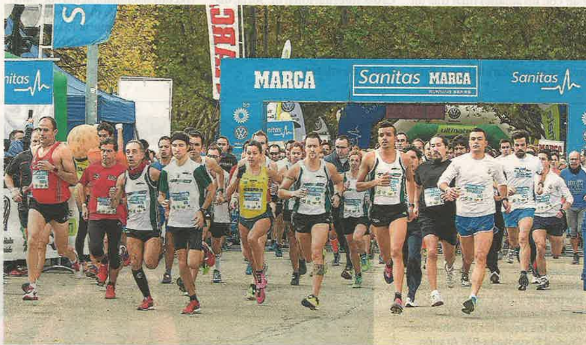
Salida de la prueba disputada ayer el entorno del parque Grande de Zaragoza. FRANCISCO JIMÉNEZ

Las Running Series, organizadas por Last Lap, se presentan con un formato de dos distancias: en el caso de la capital aragonesa, las programadas fueron 5 y 10 kilómetros. En la línea de salida de la corta no faltó la ma-