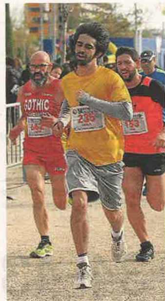
Atletas de la 5K.