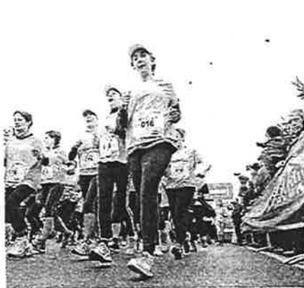
La cita discurrió por el barrio de San José.