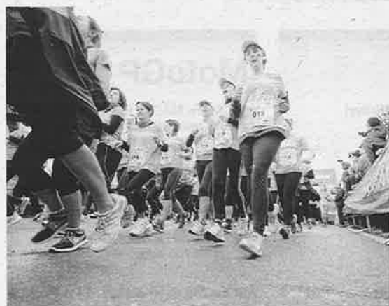
►► Lo importante de la carrera era participar.