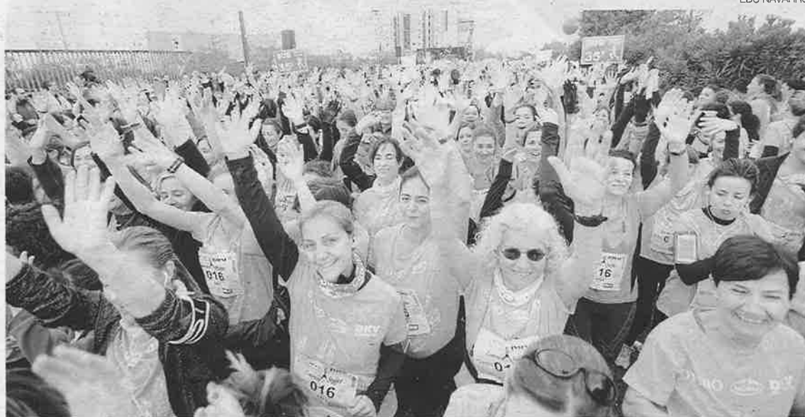
►► La salida de la carrera fue uno de los momentos de la festiva jornada.

La mañana presagiaba frío y lluvia para las participantes. Pero al final hubo suerte y cuando se dio el pistoletazo de salida había despejado y la temperatura era ideal para correr. A las participantes les esperaban 5.500 metros de longitud por el barrio de San José, con salida cerca del Príncipe Felipe y llegada en las pistas de La Granja. Pese a la amplitud de Cesáreo Alierta y Constitu-