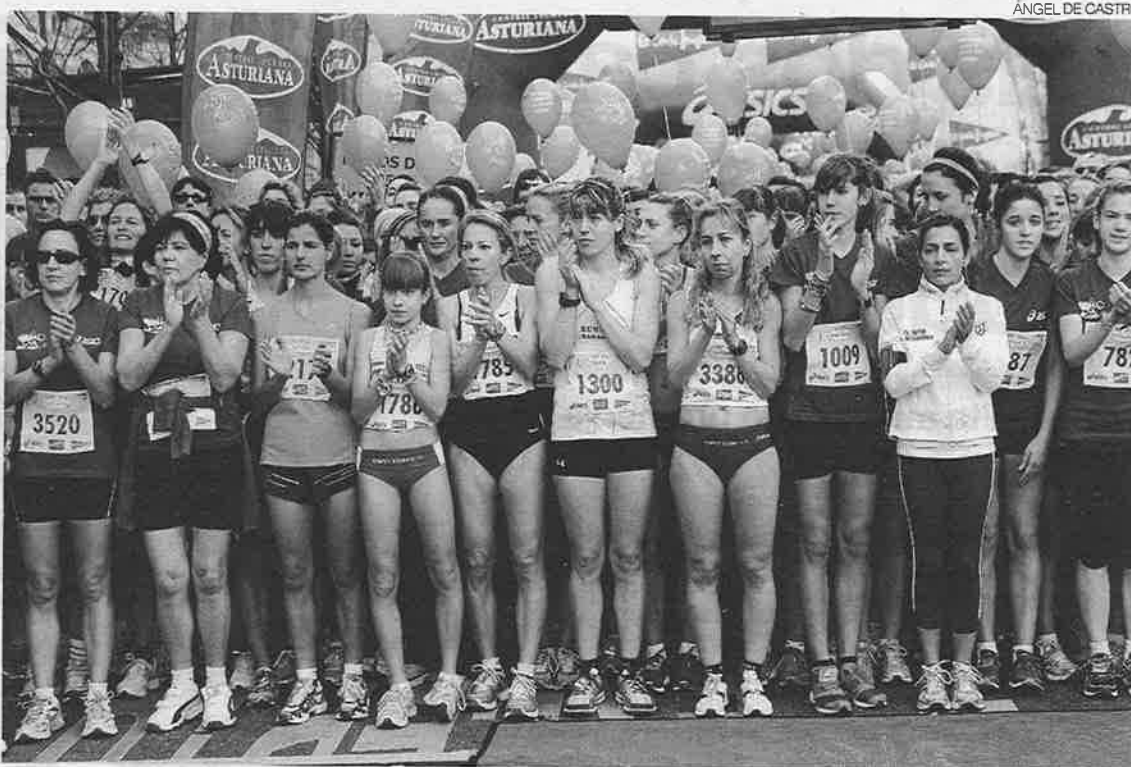
► La salida de una de las ediciones de la prueba.

«La carrera nació hace 17 años en el Parque Grande con 400 mujeres. Ahora son 6.500»