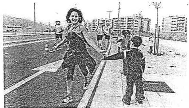
►► La carrera contó con momentos simpáticos.