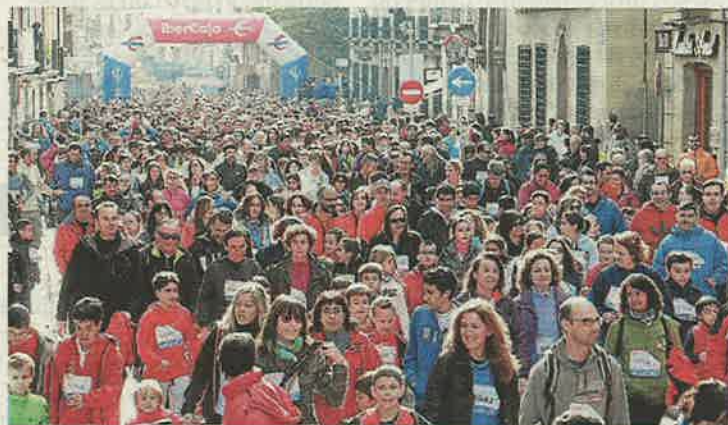
Participantes en la carrera de Ibercaja, ayer, en Huesca capital.