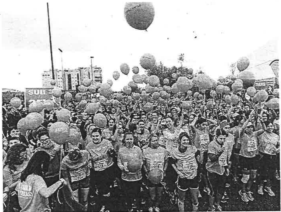
La salida de la carrera fue uno de los momentos de la jornada festiva.

Era una jornada donde lo importante era participar, por lo que muchas mujeres se dieron una buena caminata