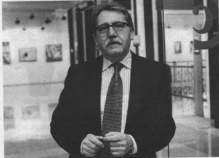
►► Teruel recibió hace unas semanas la Medalla al Mérito del Comercio.

A partir de ese momento, el empresario aragonés centró buena parte de sus esfuerzos en la