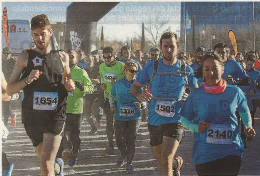
Más de 1.100 corredores dieron cuerpo a la carrera de 5 kilómetros. RAQUEL LABODÍA