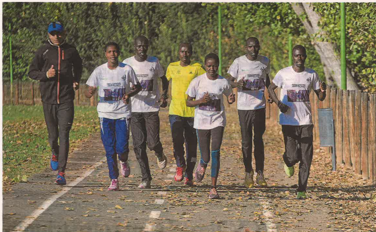
Los fondistas kenianos ya entrenan en la ciudad de Calatayud. En la imagen, una carrera de hace unos días. MACIPE