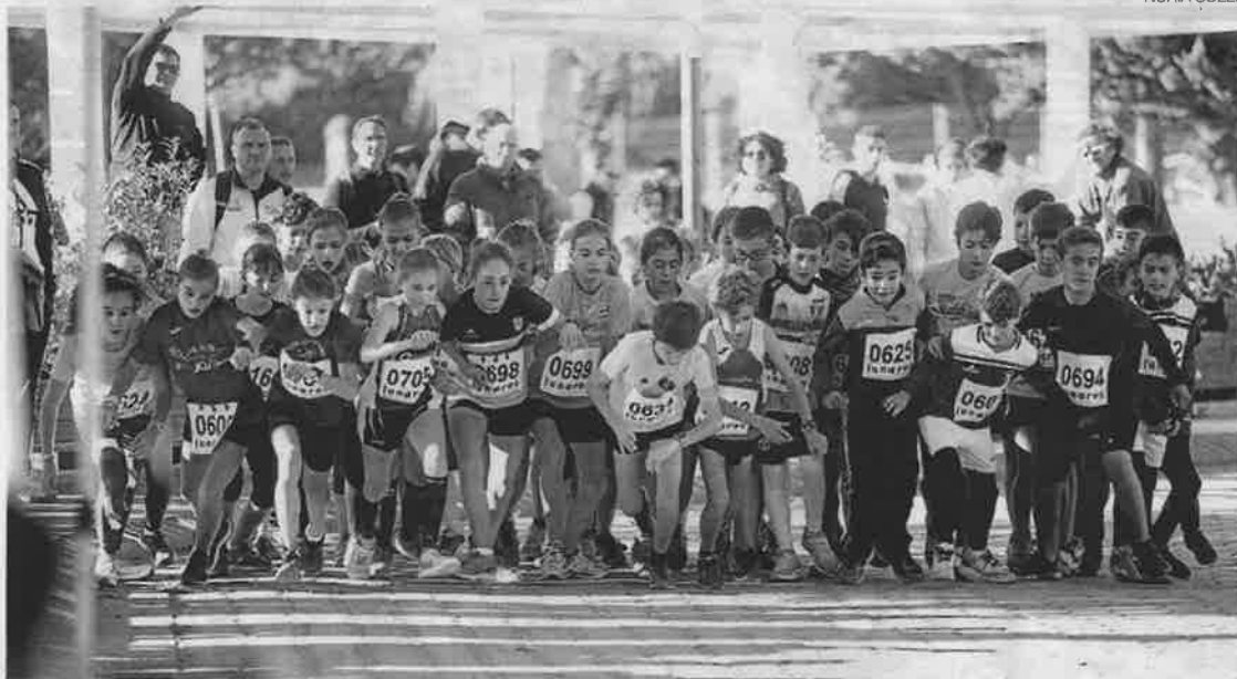
▶ La salida de una de las categorías de los más jóvenes, ayer en el Stadium Venecia.

Con un día soleado, y con un cierzo que tampoco se quiso perder la cita anual, los cerca de 500 deportistas dieron lo mejor de ellos mismos para realizar los diferentes circuitos que había preparados en función de la categoría y de la edad de los participantes.