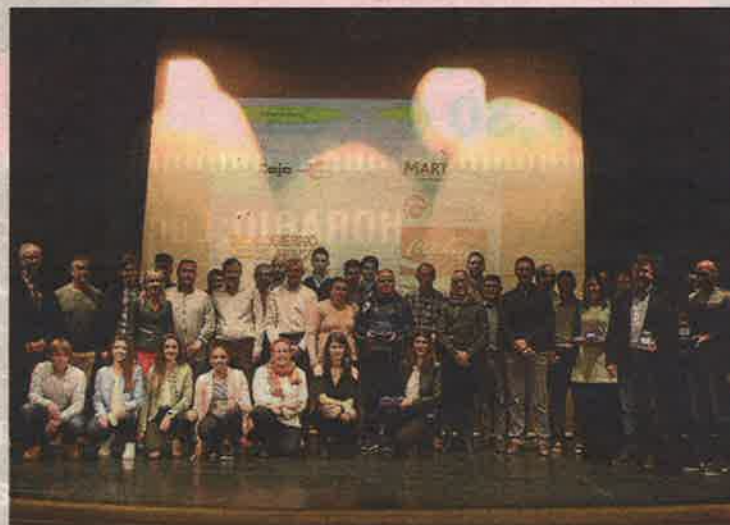
Foto de grupo de todos los galardonados en el día de ayer.

La Gala del Atletismo Aragonés se presentaba con mucha expectación. En los días anteriores a la cita se supo que la Federación