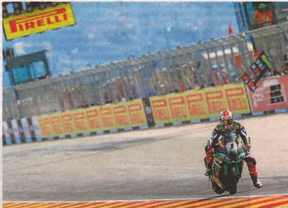
El campeón Jonathan Rea, en la pasada edición celebrada en Motorland.

En 2011, un año después de su puesta de largo en el Mundial de Moto GP, Motorland se convertía en el