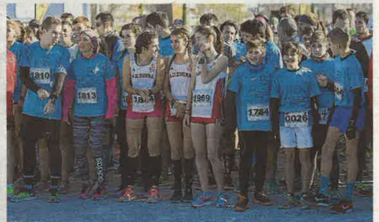
La jornada programó carreras para los más jóvenes.