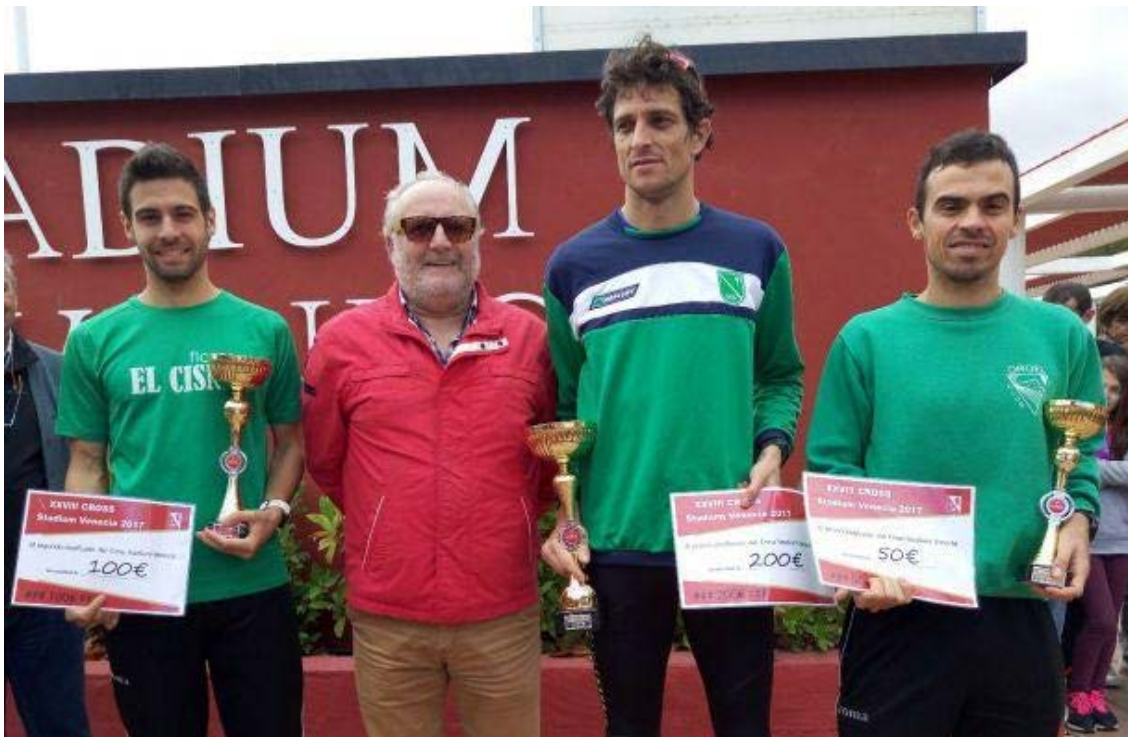
Ganadores de la Carrera Élite Masculino.