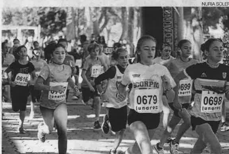
▶ Uno de los momentos de la mañana en el club de Torrero.

La mañana comenzó con la tradicional carrera popular, que con puntualidad británica dio comienzo a las 9,30 de la mañana y donde los corredores dieron un recital que encandiló a los espectadores.