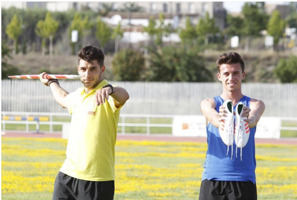
Mayo es el mejor del 2017. -

La decisión no gusta a los deportistas y Mayo se lleva el galardón masculino