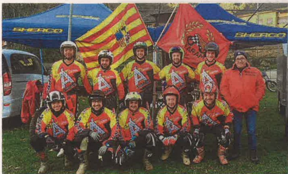
La selección aragonesa, en el circuito asturiano de Xedré.