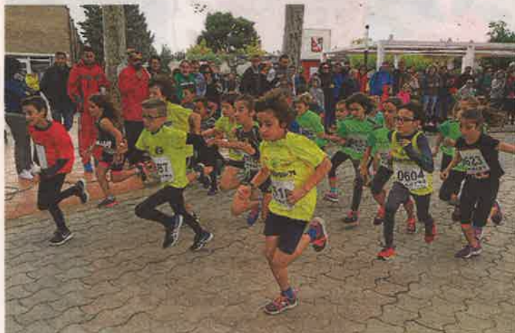
El club también programó carreras de categoría base.