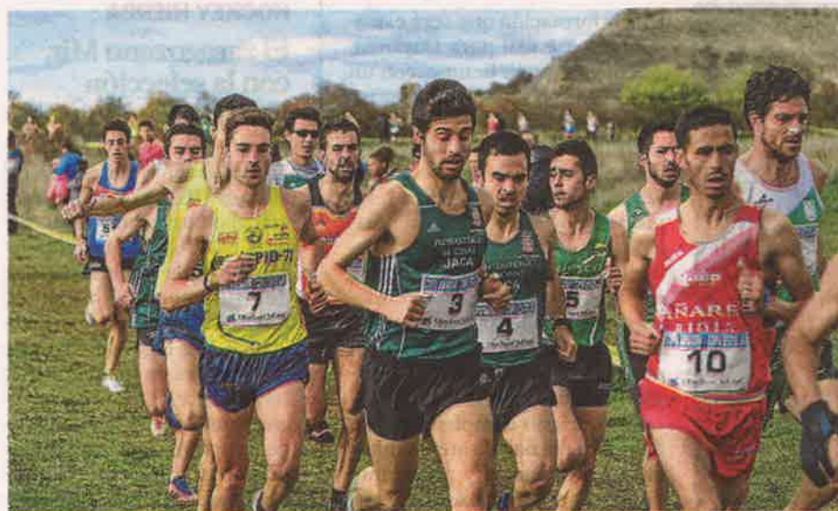
Varios corredores, en la última edición del Cross de Sabiñánigo. DAVID ANECHINA