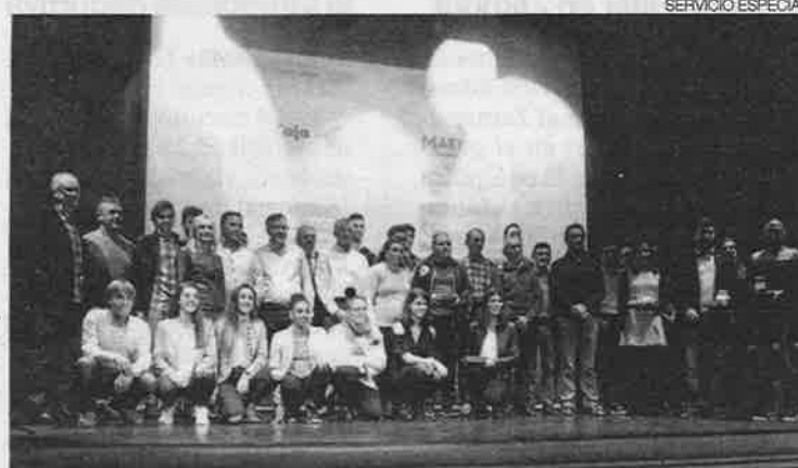
▶▶ Los galardonados en la Gala del Atletismo posan al final.