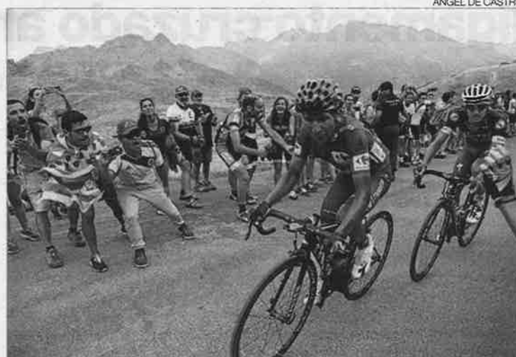
▶▶ Nairo Quintana, en la subida a Formigal de la Vuelta del año 2016.

de Javalambre, con lo que desde el Gobierno de Aragón, propietario del primero y principal accionista de Aramón, que gestiona las estaciones de esquí de Cerler, Panticosa y Formigal en Huesca y las turolenses de Valdelinares y Javalambre, se conseguiría una doble difusión, aunque varias fuentes del ejecutivo aseguraron a la agencia EFE no conocer estas negociaciones. Desde Aramón resaltaron que la estación invernal se encuentra en la cara norte y el Observatorio en la sur y que se trata de dos instalaciones total-