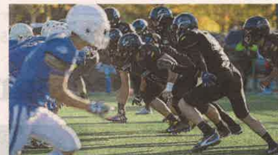
Los Hurricanes seguirán de negro en la Liga.