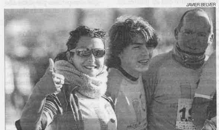
▶▶ Felicidad ▶ Pese al viento el buen rollo reinó en la mañana.