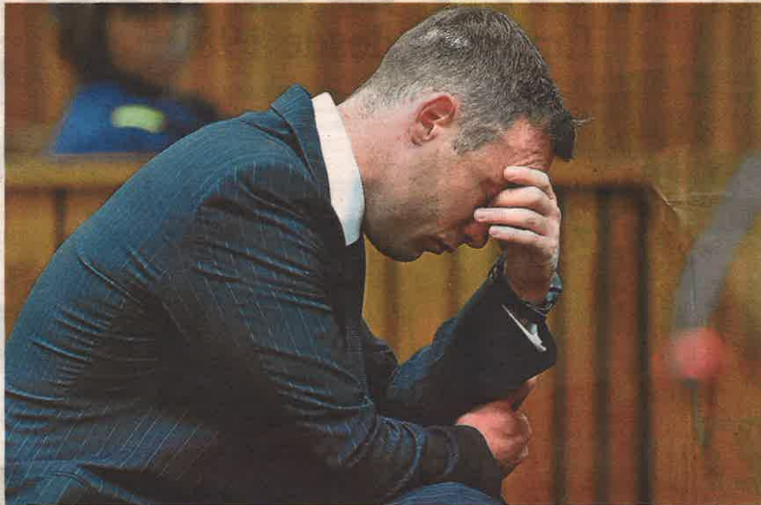
Oscar Pistorius, durante el juicio celebrado en 2016 en Pretoria (Sudáfrica).

novia en la madrugada del 14 de febrero de 2013 en su casa de Pretoria, al dispararle cuatro veces a través de la puerta cerrada del baño. El atleta alegaba que abrió fuego presa del pánico al confundir a Steenkamp con un ladrón que pensaba que había entrado en la vivienda por la ventana del retrete.