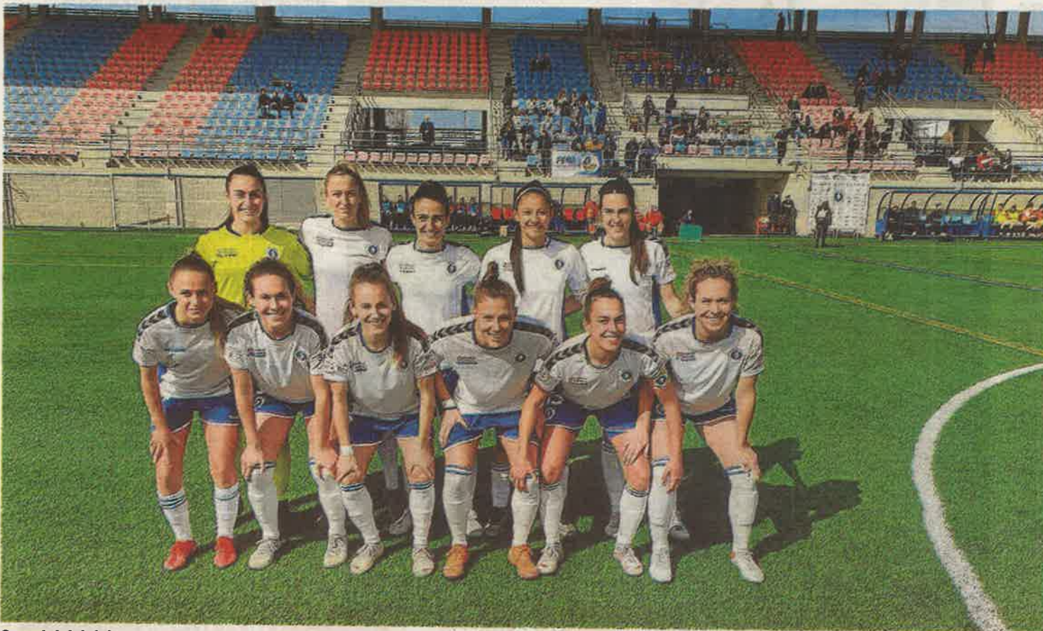
Once inicial del Zaragoza CFF en la mañana de ayer.