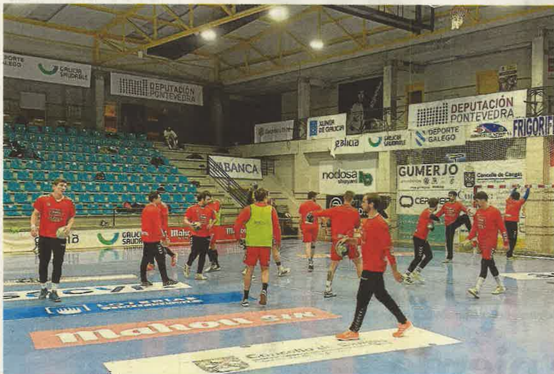
El Bada entrenó ayer por la tarde en Cangas, donde juega hoy, tras viajar durante la madrugada. BM HUESCA

● Los oscenses visitan hoy al Cangas y el jueves al Bidasoa en una semana en la que el domingo reciben al Valladolid