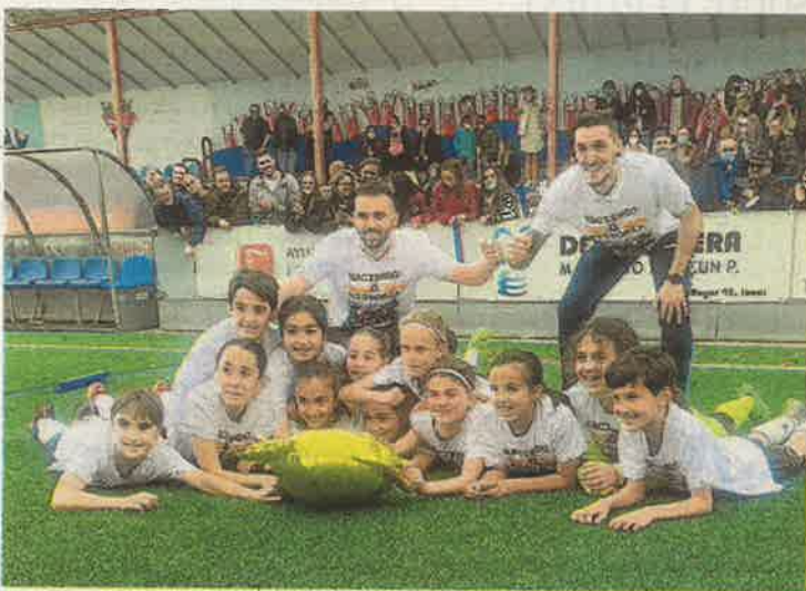
Imagen de las campeonas, ayer, y sus entrenadores.

El equipo alevín A del Zaragoza Club de Fútbol Femenino se ha convertido en el primer equipo femenino de Aragón que gana una Liga mixta, en la que ha tenido que competir únicamente contra equipos de chicos. Las alevines del Zaragoza CFF, de 10 y 11 años, eran el único equipo femenino de su grupo y han logrado proclamarse campeonas de Liga a falta de tres jornadas de campeonato después de vencer ayer al Zuera por el abultado resultado de 1 a 11. HA