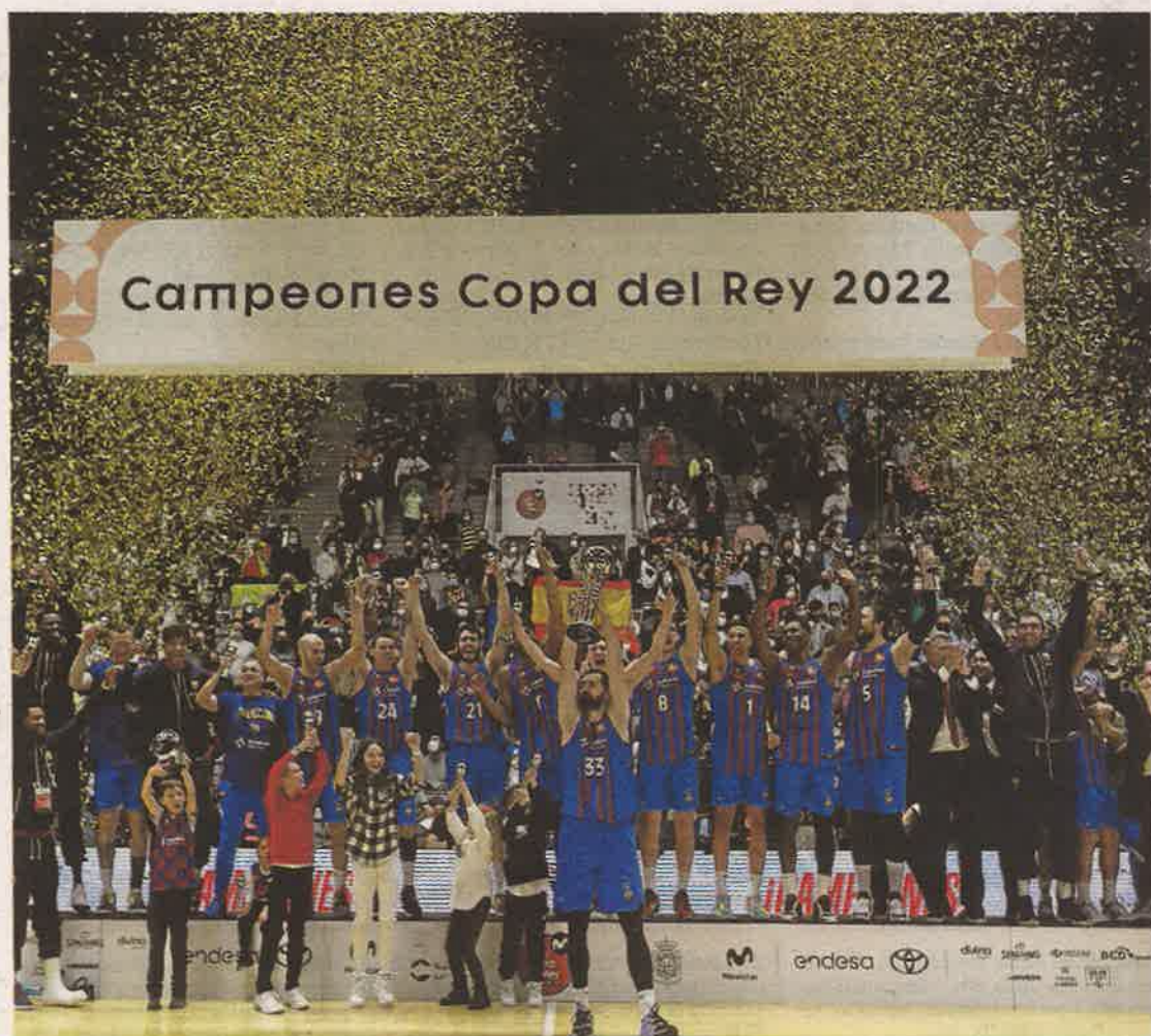
Mirotic levanta el trofeo de campeón de Copa del Rey.