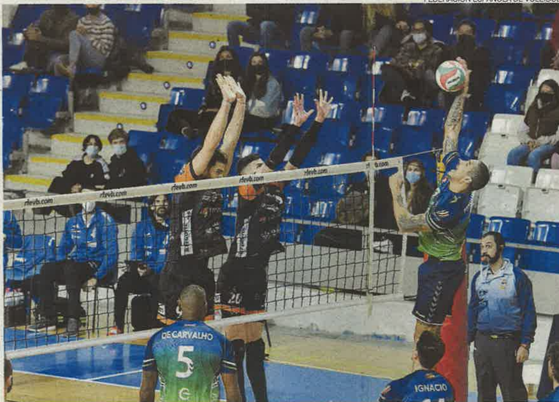
Dos jugadores del CV Teruel intentan hacer un bloqueo en el partido ante el Palma.

La expedición turolense llegó ayer a Las Palmas de Gran Canaria, sede de la Copa este año, por lo que no ha dispuesto de demasiado tiempo de aclimatación. Sin posibilidad de realizar un entrenamiento completo, el equipo hizo por la tarde unos ejercicios de estiramientos y una sesión de vídeo para preparar el choque ante los baleares, que son sextos en la competición doméstica, un punto por encima de los aragoneses. Eso sí, en el precedente más inmediato, en el mes de diciembre, los turolenses batieron al conjunto isle-