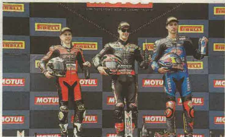
Podio de las Superbikes en Motorland, con Rea en lo alto.

El circuito de Motorland Aragón vivió la primera carrera del año en la que los tres favoritos cumplieron los pronósticos y se subieron al podio y en donde los españoles Iker Lecuona y Xavi