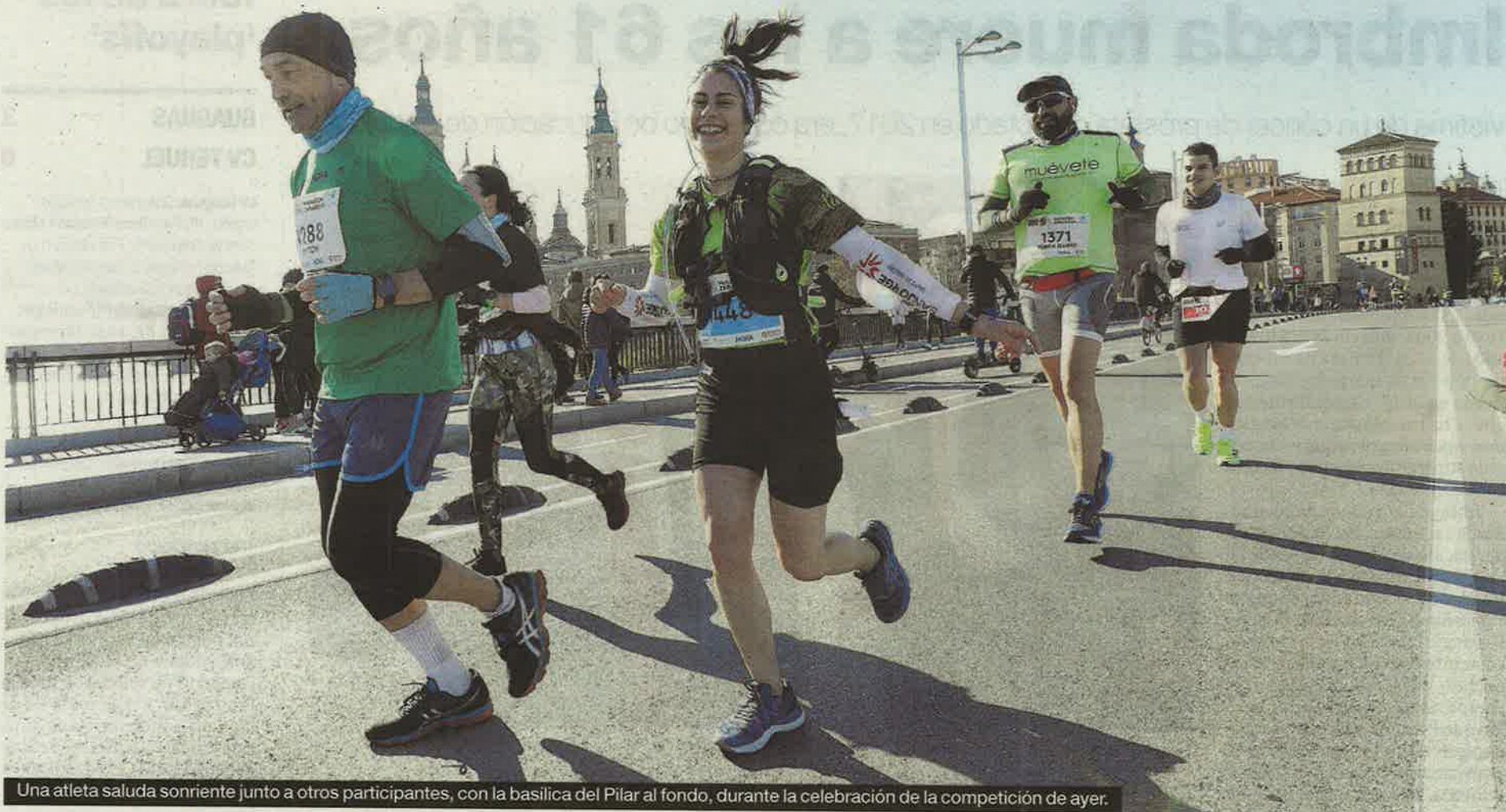
Una atleta saluda sonriente junto a otros participantes, con la basílica del Pilar al fondo, durante la celebración de la competición de ayer.