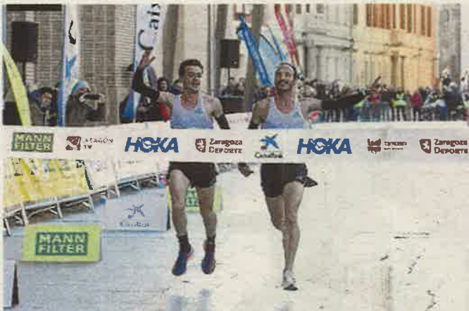
Mayo y Abadía cruzan la meta del 10K Zaragoza. GUILLERMO MESTRE