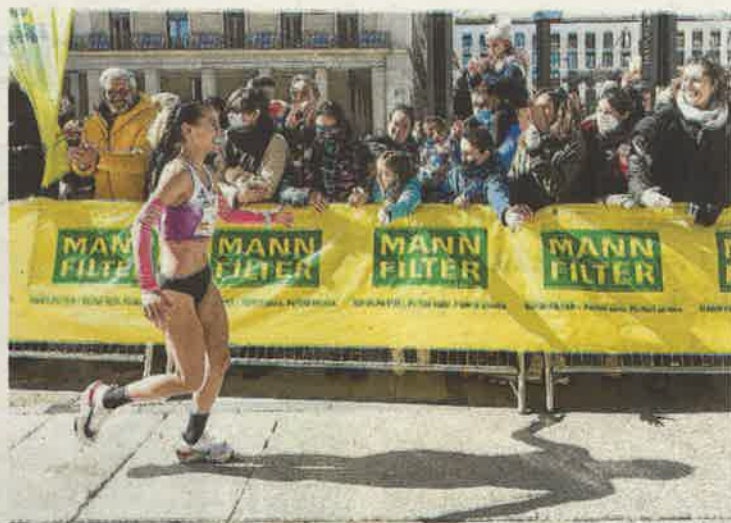
Los aficionados llenaron la plaza del Pilar.