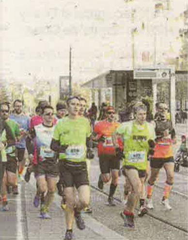
Corredores en Independencia.