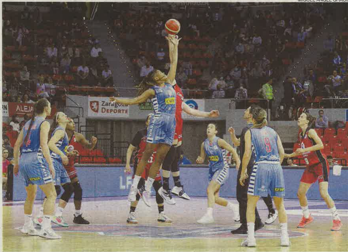
Salto inicial del partido de ayer entre el Casademont y el Cadí La Seu.