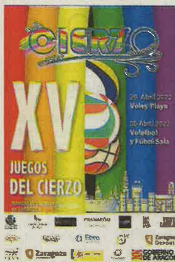
El cartel de los Juegos del Cierzo.

De esta forma, 76 equipos procedentes de Madrid, Barcelona, Valencia, Torremolinos y París competirán en la capital aragonesa en las modalidades deportivas de voleibol, fútbol sala y vóley playa. Durante la competición se disputarán 220 partidos, en los que