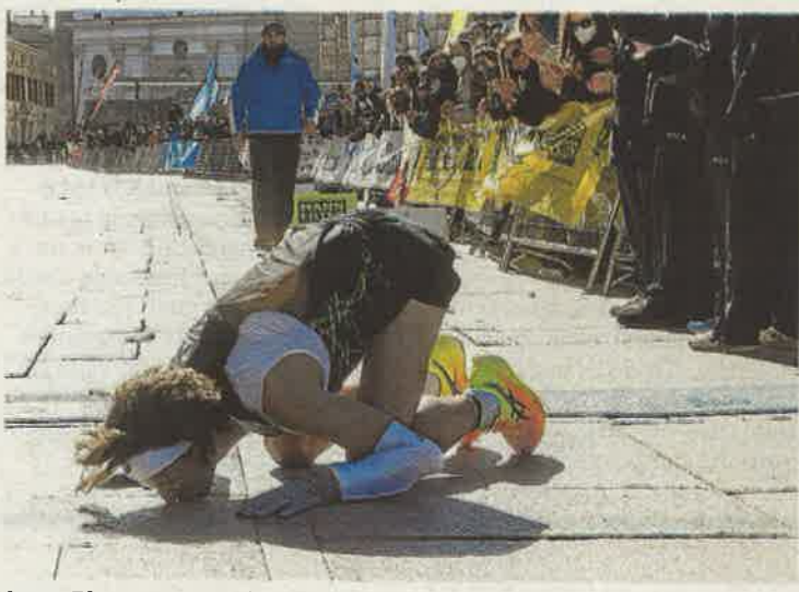
Jorge Blanco, campeón de España de maratón, besa el suelo. G. MESTRE