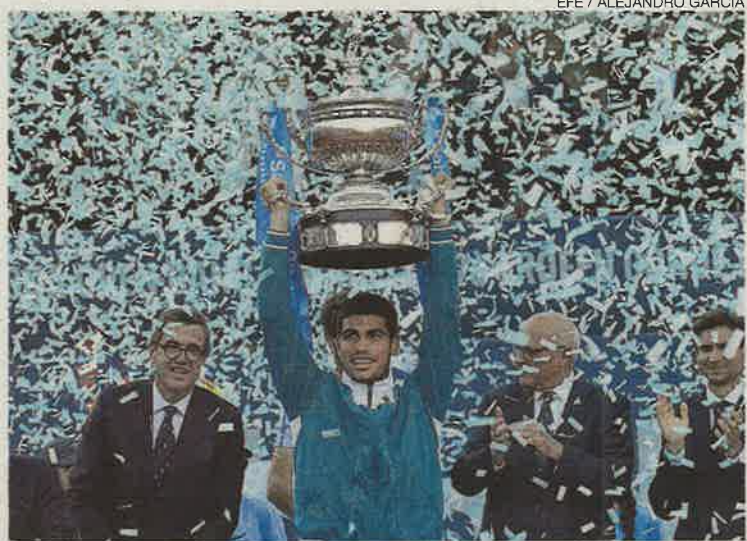
Alcaraz levanta el trofeo de campeón ante una lluvia de papeles azules.

Jamás habían llegado al último partido en Barcelona ninguno de los dos y la pista central les recibió llena, con una gran ovación. El partido arrancó con dos juegos en blanco para cada uno asegurando su servicio. Pero cambió el panorama en el quinto cuando el murciano con un juego agresivo e impo-