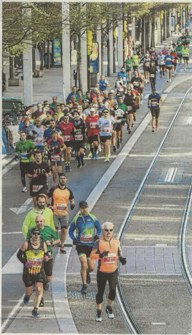
La prueba congregó corredores de todas las edades. G. MESTRE