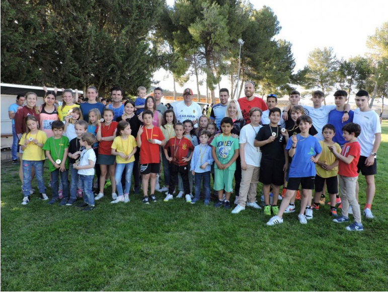
Participantes en las carreras infantiles y absoluta.S.E.

NOTICIA ACTUALIZADA 5/5/2022 A LAS 11:08 D.A.