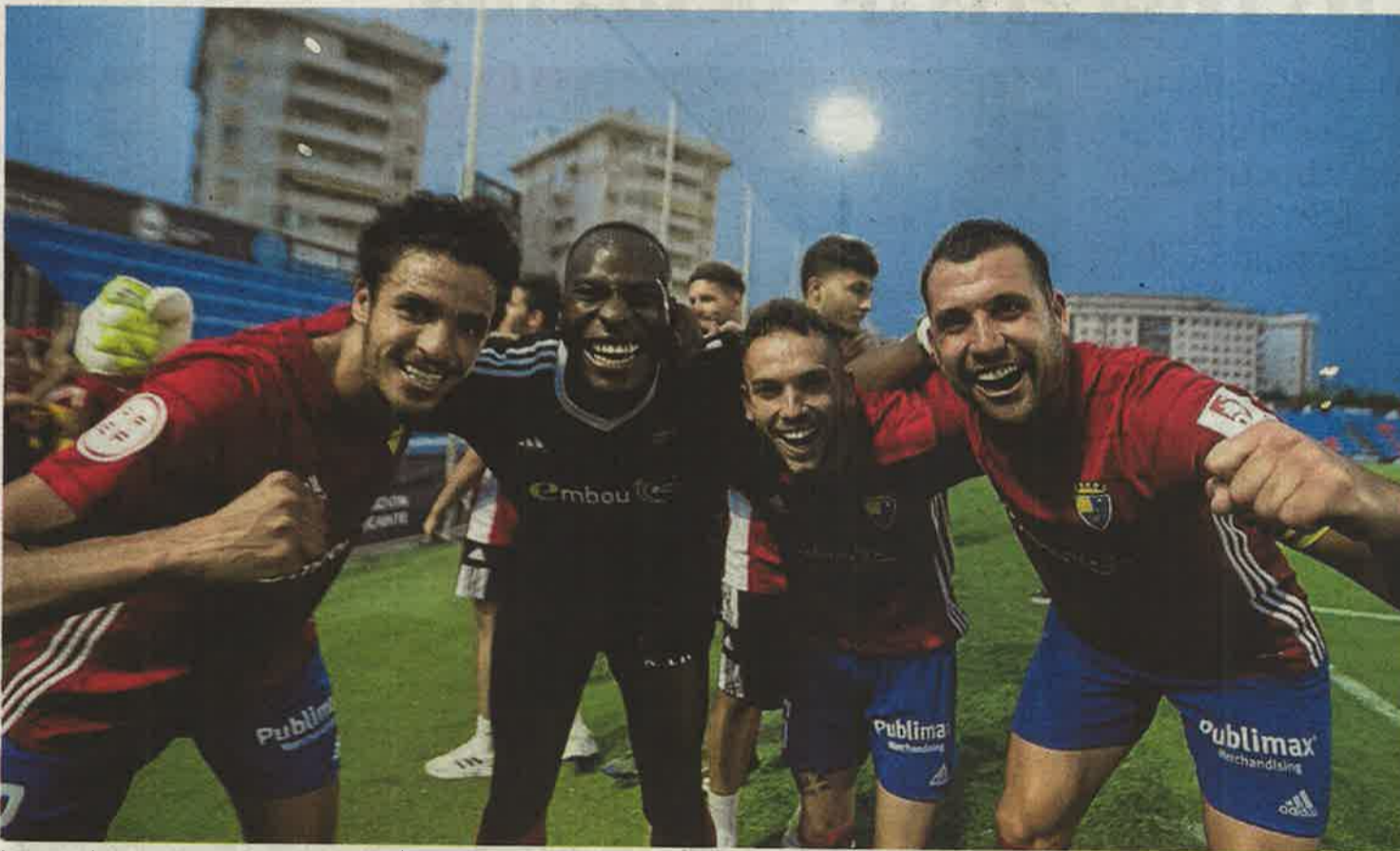
Los jugadores del CD Teruel celebran su pase a la final por el ascenso la semana pasada tras eliminar al Cacereño. CD TERUEL