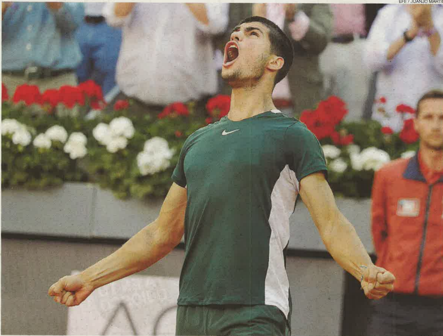
Carlos Alcaraz celebra con euforia su triunfo ante Zverev.