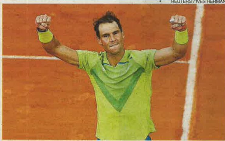
Rafa Nadal celebra su victoria en cinco sets ante Auger-Aliassime.

energía, cometía demasiados errores (11) y su saque tampoco le ayudaba (50%), en un día nublado, ambiente frío (16 grados), sobre una pista lenta y húmeda que no es la mejor para mover la bola.