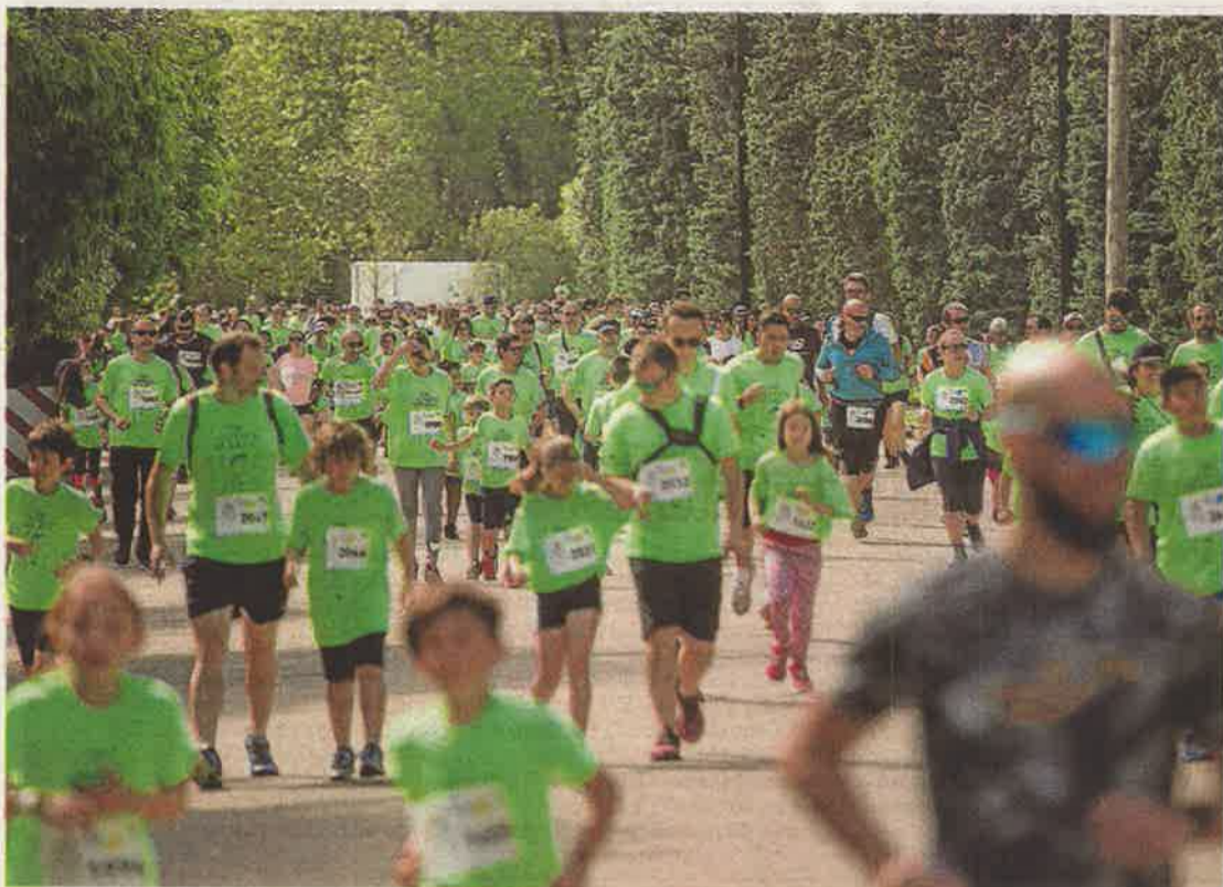
La 'marea verde' de la carrera de Atades invadió ayer el parque Grande y su entorno. TONI GALÁN