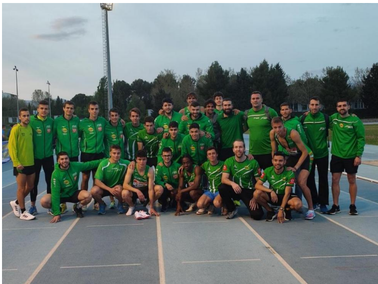
Equipo de Intec-Zoiti el pasado sábado en Huesca.M.A.B.

Intec-Zoiti y los dos equipos de Hinaco Monzón ya conocen a sus rivales para la segunda jornada de la Liga de Clubes de Primera División que se disputará el sábado 13 de mayo.