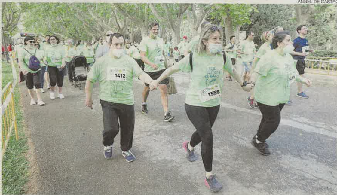
Comprometidos ▷ La carrera fue un éxito de participación en el parque zaragozano.

La VIII Carrera solidaria Atades contó con recorridos adaptados tanto para deportistas experimentados como para personas con capacidades diversas y grupos familiares, en dos modalidades: la 5 K y la 1 K. En el recorrido