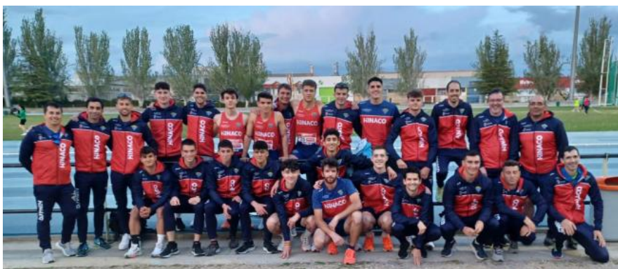
Equipo masculino del Hinaco el sábado en Huesca.S.E.

El equipo masculino de Hinaco Monzón se enfrentará el 13 de mayo al Celta, Elche y Super Amara BAT . El encuentro podría ser en Monzón o San Sebastián si nos atenemos a la equidistancia geográfica. Celta y Elche son los favoritos e Hinaco peleará por la tercera plaza con el Super Amara .