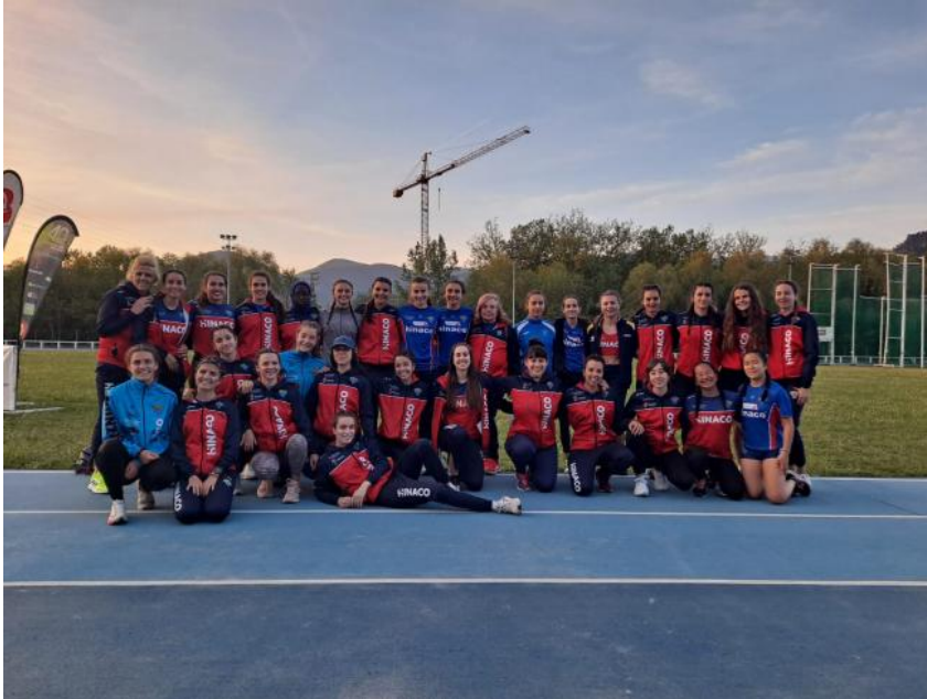
Equipo femenino del Hinaco, el sábado en Durango.