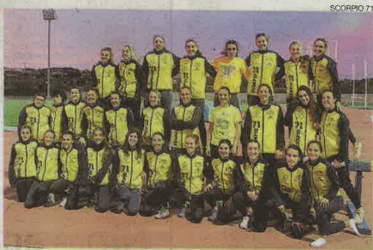
Foto de equipo del Alcampo-Scorpio 71 que compitió en Zaragoza.