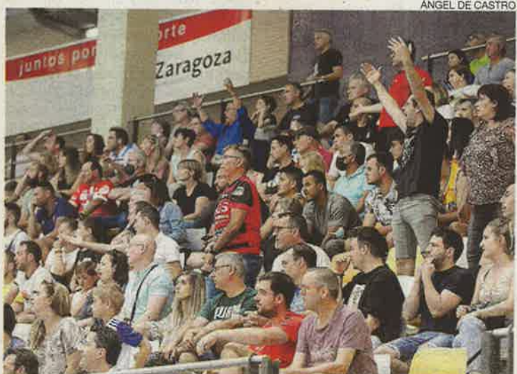
La grada del pabellón Siglo XXI presentó un gran aspecto.