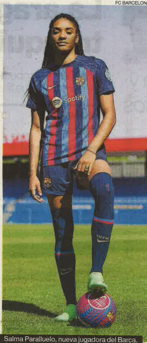
Salma Paralluelo, nueva jugadora del Barça.