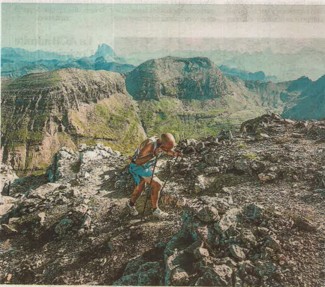
Miguel Caballero, durante el 2KV de Villanúa, donde se hizo con el triunfo.