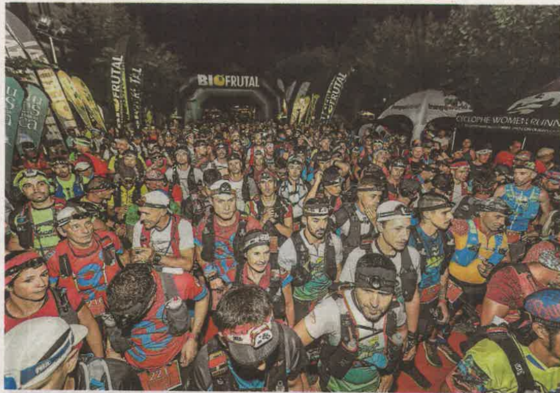
Los participantes partieron de noche desde la avenida de los Tilos de Benasque. JAVIER BARAHONA

«Ha sido impresionante, me ha sorprendido mucho la cantidad de gente que había animando por el recorrido. Es mi cuarta o quinta vez aquí, había subido al podio, pero nunca había ganado, así que estoy muy contento», explicó Aspiroz tras su triunfo en la prueba reina, y después de haber superado una compleja lesión de tobillo que le ha tenido apartado durante casi tres años.