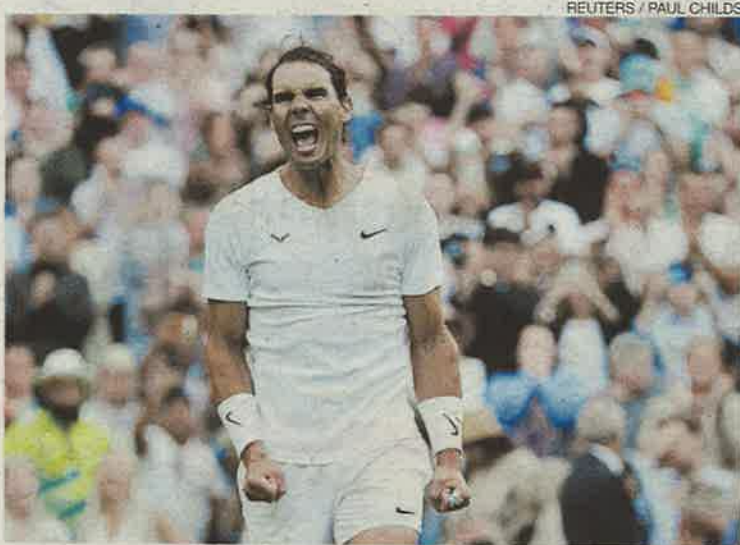
Nadal celebra su victoria que le permite acceder a cuartos de final.

No concedió Nadal la primera bola de rotura hasta el primer juego del segundo set. De poco le sirvió eso al 21 cabeza de serie, quien tuvo que presenciar impotente cómo el manacorí abría el tarro de las esencias.