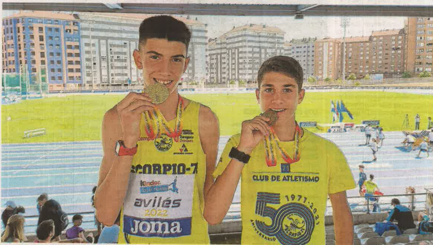
Los campeones catan la medalla de oro recién conquistada. ALCAMPO-SCORPIO 71