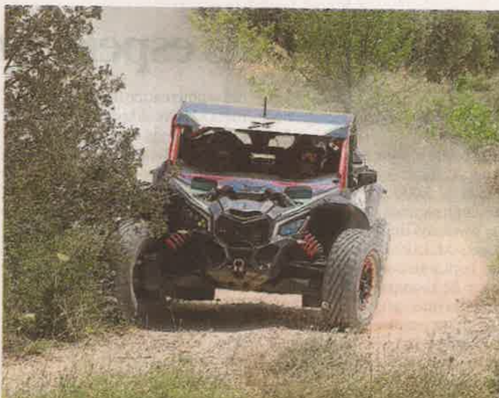
El IV Tramo de Tierra de Castelserás se disputó con mucho calor. FAA