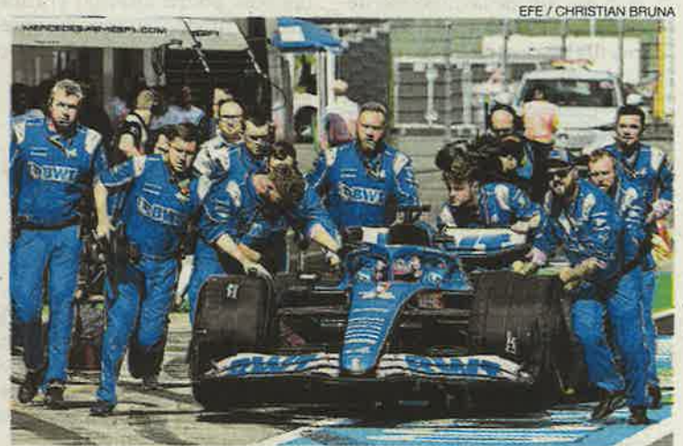
Los mecánicos arrastran el Alpine de Alonso, que no arrancó en la salida.

en el monoplaza de Alpine. El piloto asturiano no pudo hacer la vuelta de formación y tras ser enviado al pit lane para intentar solventar el problema, terminó regresando al box empujado por sus mecánicos, sin que su coche arrancara. Una nueva decepción para Fernando, que además ve sensiblemente lastradas sus opciones en la carrera principal, ya que la parrilla de hoy se ordena en base a la carrera esprint y Fernando tendrá que salir penúltimo, so-