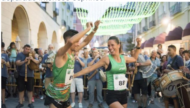
XXII Carrera Pedestre de San Lorenzo

El club A Ixena ha tomado el relevo del Club Atletismo Huesca en la organización, y ha mantenido el listón igual de alto. Los Gaiteros de Tierra Plana han amenizado toda la carrera y el público ha podido disfrutar de las evoluciones de los atletas, sazonadas por esas primas que se van repartiendo de manera aleatoria entre los corredores y que han deparado intensos esprines.