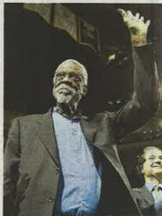
Russell, ganador de once anillos.

Dirigió a los Celtics en calidad de técnico-jugador de 1966 a 1969 y conquistó los títulos de 1968 y 1969. «Más allá de los triunfos, su forma de entender las batallas es lo que iluminó su vida. (...) Bill denunció las in-