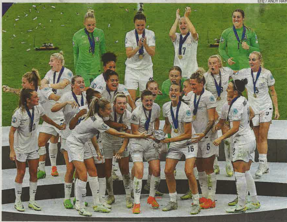
Las jugadoras de Inglaterra levantan el trofeo como campeonas de Europa en Wembley.

Una final entre Alemania e Inglaterra nunca puede ser tranquila. Por mucho que el marcador no se mueva, estos dos países tienen muchas cuentas pendientes entre sí y sus duelos están empapados