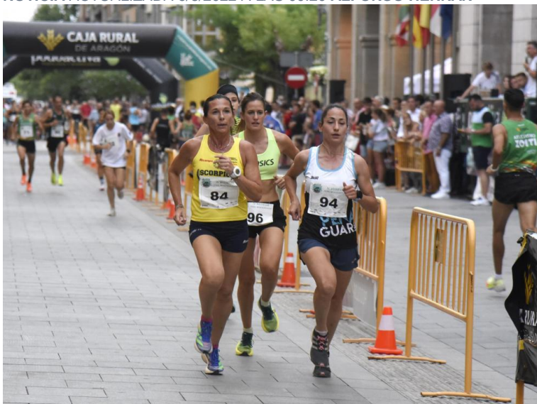
Detalle de la carrera, en la que el público abarrotó todo el recorrido. Javier Navarro

NOTICIA ACTUALIZADA 9/8/2022 A LAS 00:20 ALFONSO HERRÁN