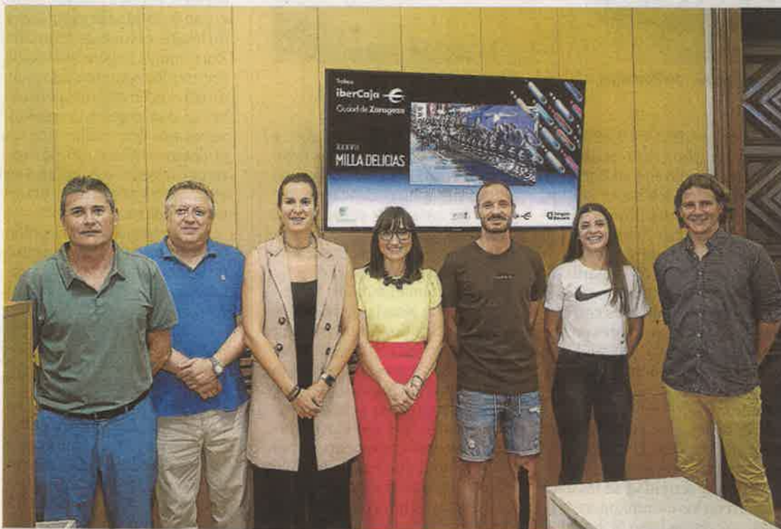
Momento de la presentación de la Milla Delicias, en el Ayuntamiento de Zaragoza. HA