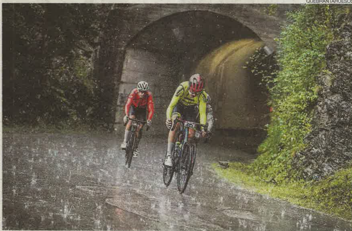
Autoexigencia ▶ Ciclistas en la pasada edición de la Quebrantahuesos en la que se corrió con chubascos.

Por otro lado, para algunos ciclistas la competición perdió parte de su esencia cuando el 16 de junio se anunció su postponición. «Siempre he dicho que el 7 de julio es San Fermín, 12 de octubre el