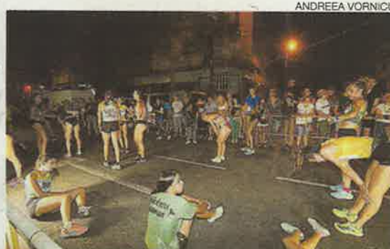
Varias participantes, exhaustas tras la carrera.