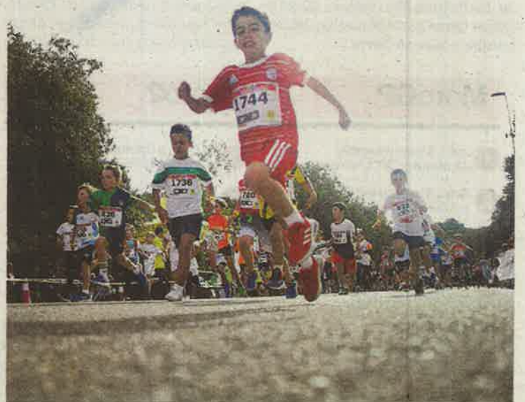
Imagen de una de las carreras disputadas ayer.

por Alcampo y el club de atletismo Alcampo-Scorpio71, con el apoyo del Gobierno de Aragón, Ayuntamiento de Zaragoza y Cronomena, y bajo control del Comité de Jueces de la Federación Aragonesa de Atletismo. El Colegio Nuestra Señora del Carmen logró el premio de 400 euros en material deportivo, al introducir en meta 103 participantes. Por otro lado, el club de atletismo Alcampo-Scorpio71 ganó el trofeo en la clasificación por puntos. ≡