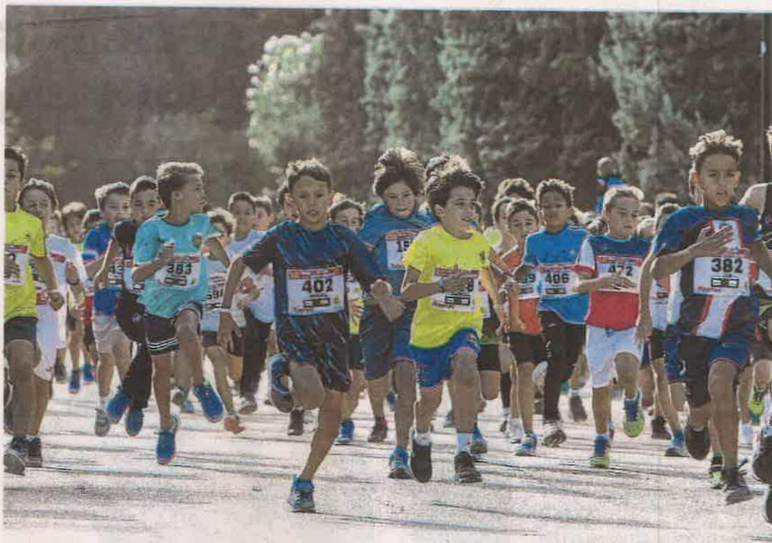
Carrera de la Infancia celebrada ayer en el Parque Grande de Zaragoza. OLIVER DUCH

Entre todas las pruebas celebradas, la destacada fue la Carrera Fundación Down, en la que más de 40 corredores con diversidad funcional pudieron participar también de la fiesta del atletismo.