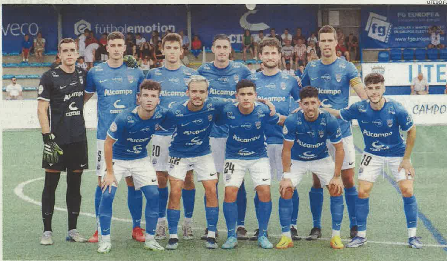
Preparados &gt; El once inicial del Utebo FC en un partido de pretemporada.