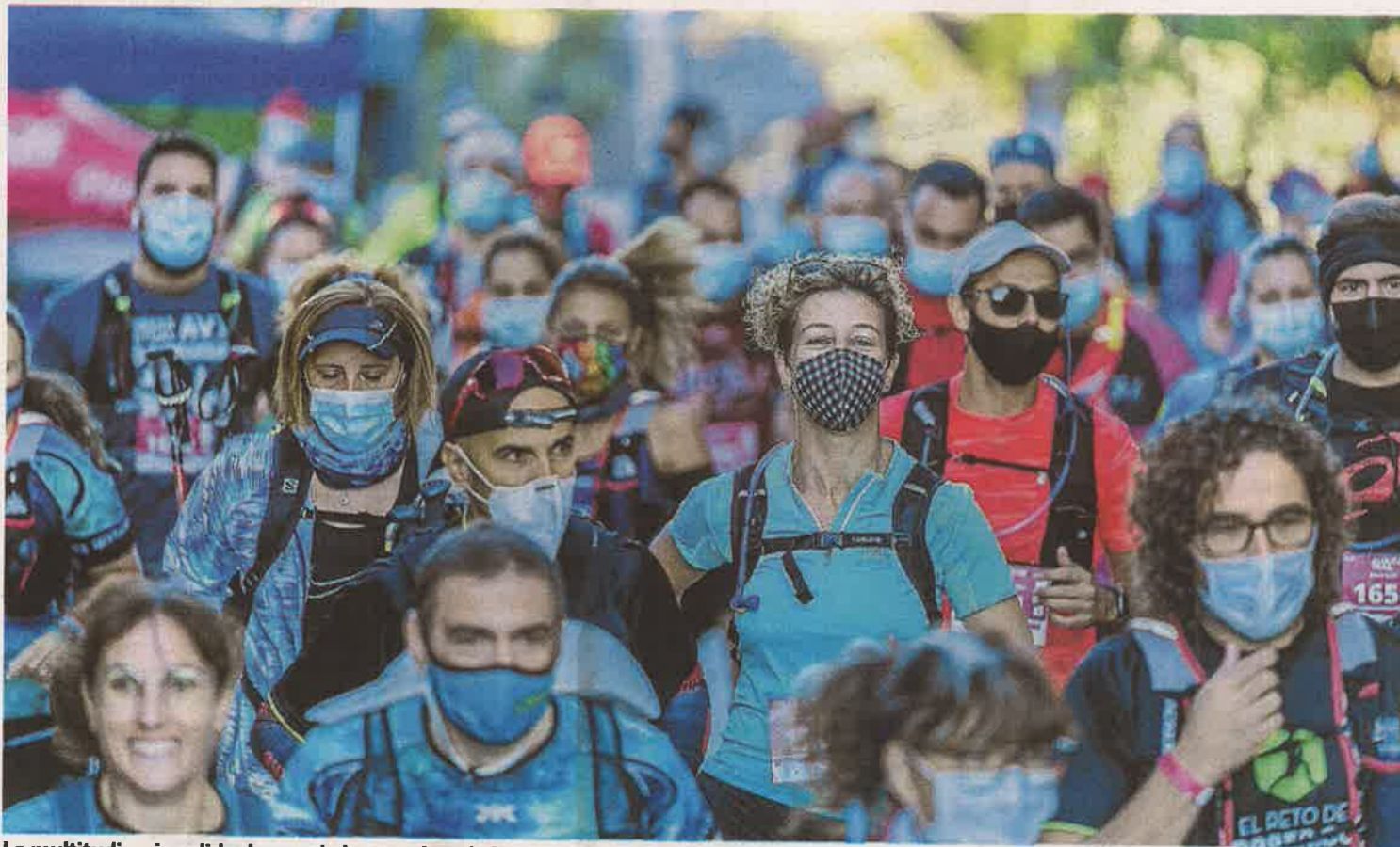
La multitudinaria salida de una de las pruebas de la edición del pasado año de la Guara Somontano.