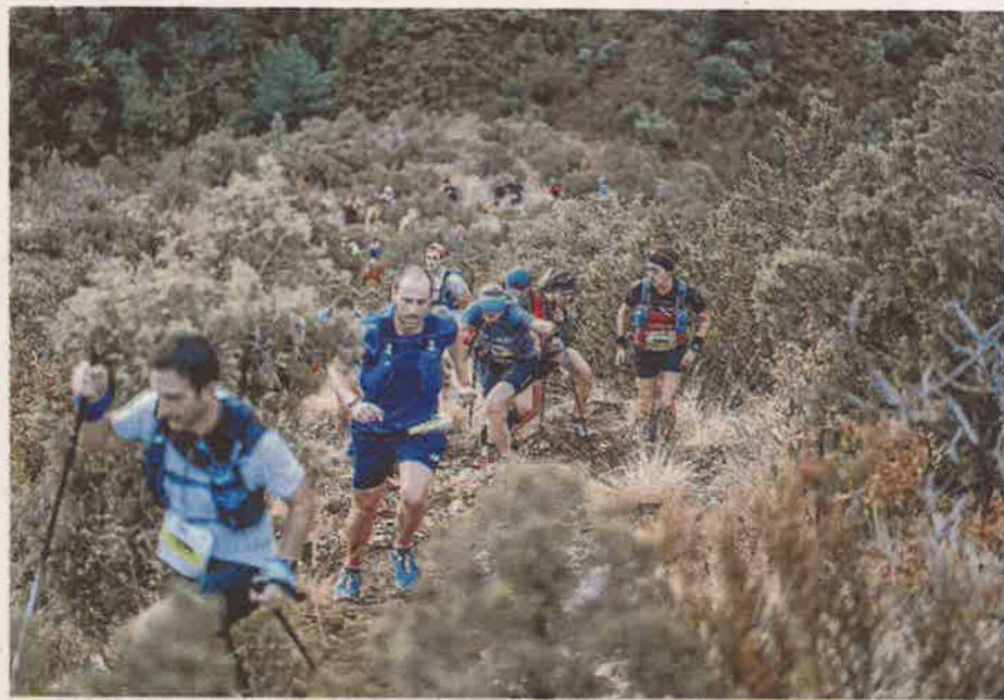
Alquézar y su entorno acogió la Ultra Trail Guara Somontano.