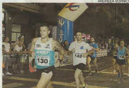
La participación volvió a ser muy elevada.