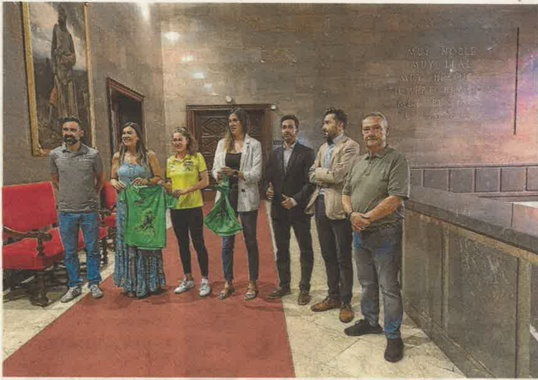
La presentación de la carrera fue en el Ayuntamiento de Zaragoza. JOSÉ MIGUEL MARCO